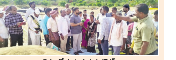
రైతులతో మాట్లాడుతున్న కలెక్టర్

నాగర్ కర్నూల్ ప్రతినిధి, మే 19 ప్రభాతవార్త: రైతులు పండించిన పంటకు న్యాయమైన ధరతో పాటు సకాలంలో చెల్లింపులు అందేలా కొనుగోలు కేంద్రాలు సమర్థవంతంగా పనిచేయాలని జిల్లా కలెక్టర్ హేమంత్ కేసవ్ పాటిల్ అధికారులను సూచించారు. ధాన్యంలో తేమ శాతం ఎక్కువగా ఉంటే కొనుగోలు అలస్యమవుతుందని వివరించాల్సి రైతులకు స్పష్టంగా అవగాహన కల్పించాలని ఆదేశించారు. కోడూర్ మండల పరిధిలోని పసుపుల గ్రామంలో ప్రాథమిక వ్యవసాయ సహకార కేంద్రం అధ్యక్షులతో కొనసాగుతున్న పరిధాన్యం కొనుగోలు కేంద్రాన్ని మంగళవారం ఉదయం జిల్లా కలెక్టర్ హేమంత్ కేసవ్ పాటిల్ సందర్శించారు. ధాన్యం కొనుగోలు కేంద్రాన్ని సందర్శించి కొనుగోలు ప్రక్రియను సమగ్రంగా పరిశీలించారు. రైతులు తీసుకోవచ్చిన పరిధాన్యాన్ని ప్రత్యేకంగా పరిశీలించిన ఆయన, ధాన్యంలో ఉన్న తేమశాతాన్ని ప్రత్యేకంగా తనిఖీ చేశారు. రాష్ట్ర ప్రభుత్వం నిర్దేశించిన ప్రమాణాల ప్రకారం ధాన్యం కొనుగోలు జరుగుతున్నదా లేదా అనే అంశంపై అధికారులు, నిపుణులు అడిగి జిల్లాకలెక్టర్ వివరాలు తెలుసుకున్నారు. ఈ