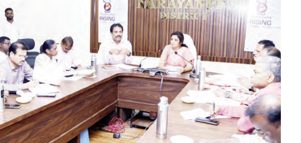
అధికారులతో మాట్లాడుతున్న జిల్లా కలెక్టర్ సీహెచ్ ప్రయాంత్

నారాయణపేట, మే 19 ప్రభాతవార్త: నారాయణపేట జిల్లా కేంద్రంలో ఈ నెల 22న నిర్వహించనున్న ప్రజా పాలన ప్రగతి ప్రణాళిక 99 రోజుల కార్యచరణ జిల్లా స్థాయి కార్యక్రమానికి అన్ని ఏర్పాట్లు చేయాలని జిల్లా కలెక్టర్ సీహెచ్ ప్రయాంత్ అధికారులను ఆదేశించారు. కలెక్టరేట్ పీసీ హాలోలో వివిధ శాఖల అధికారులతో ఆమె సమీక్ష సమావేశం నిర్వహించారు. రాష్ట్రవ్యాప్తంగా మార్చి 6 నుంచి జూన్ 12 వరకు ప్రజాపాలన ప్రగతి ప్రణాళిక కార్యక్రమాలు కొనసాగుతున్నాయని తెలిపారు. జిల్లాలో ఇప్పటివరకు గ్రామ, మండల, నియోజకవర్గ స్థాయిల్లో పలు కార్యక్రమాలు నిర్వహించినట్లు చెప్పారు. అభివృద్ధి కార్యక్రమాల ఫోటోలు, అభివృద్ధి వివరాలు, నిధుల సమాచారాన్ని సిద్ధంగా ఉంచాలని సూచించారు. ప్రభుత్వ సంక్షేమ పథకాలపై శాఖల వారీగా స్టాఫ్ ఏర్పాటు చేయాలని ఆదేశించారు. అన్ని శాఖల సమన్వయంతో కార్యక్రమాన్ని విజయవంతం చేయాలని పేర్కొన్నారు. ప్రజా ప్రతినిధులను కార్యక్రమానికి ఆహ్వానించాలని సూచించారు. స్ట్రీట్, సౌండ్ సిస్టమ్ ఏర్పాట్లపై సంబంధిత అధికారులు చర్యలు తీసుకోవాలని చెప్పారు స్టాఫ్, భోజన ఏర్పాట్లను