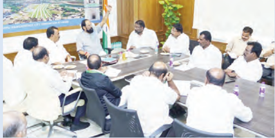
ఉమ్మడి మహబూబ్ నగర్ జిల్లా మంత్రిలు, ఎమ్మెల్యేలతో ప్రత్యేక సమావేశంలో మాట్లాడుతున్న మంత్రి ఉత్తమ కుమార్ రెడ్డి