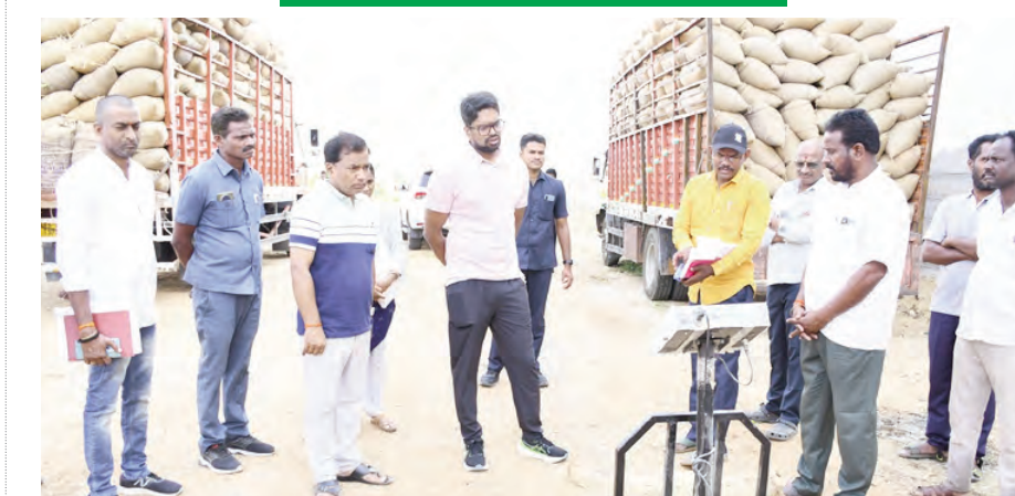
రైస్ మిల్లుల వద్ద తాగునీరు పరిశీలన జిల్లా కలెక్టర్