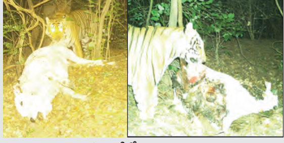
పెద్దపులి దాడిలో మృతి చెందిన ఆవు